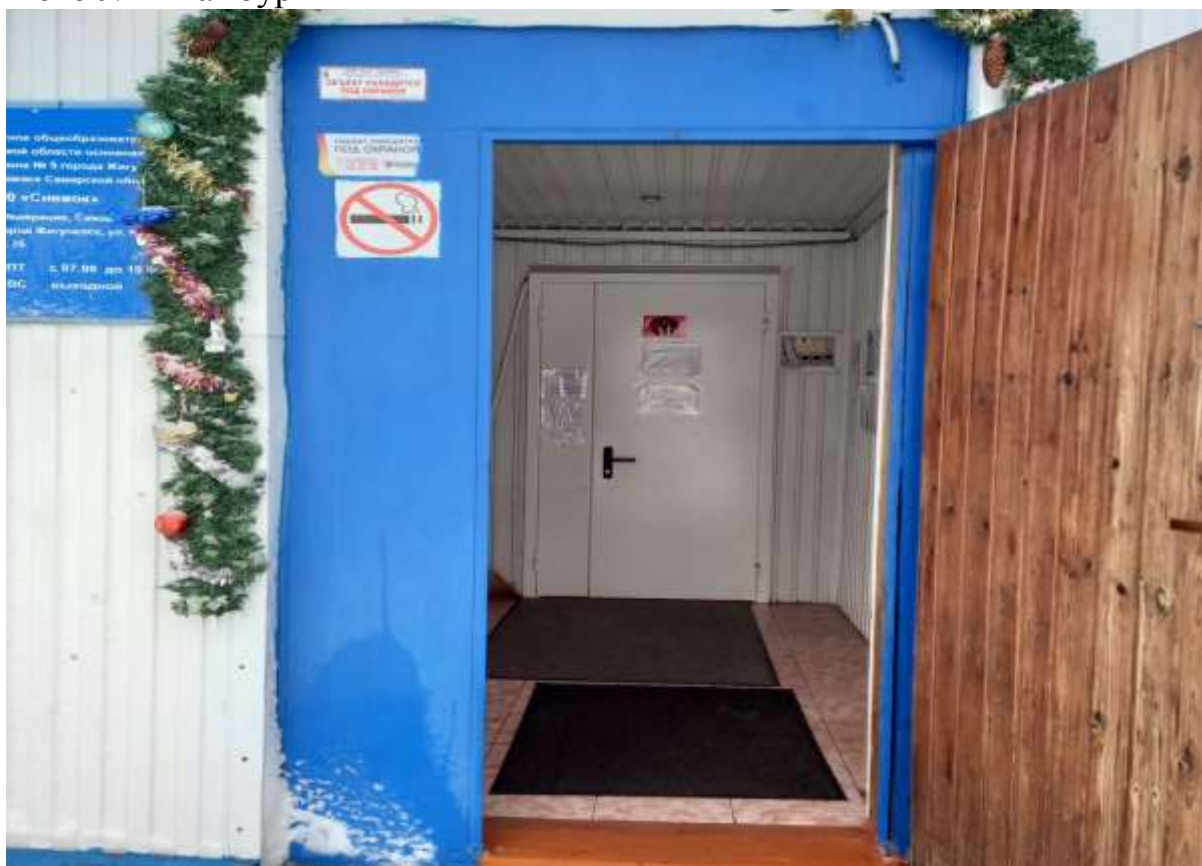
Фото № 2а тамбур