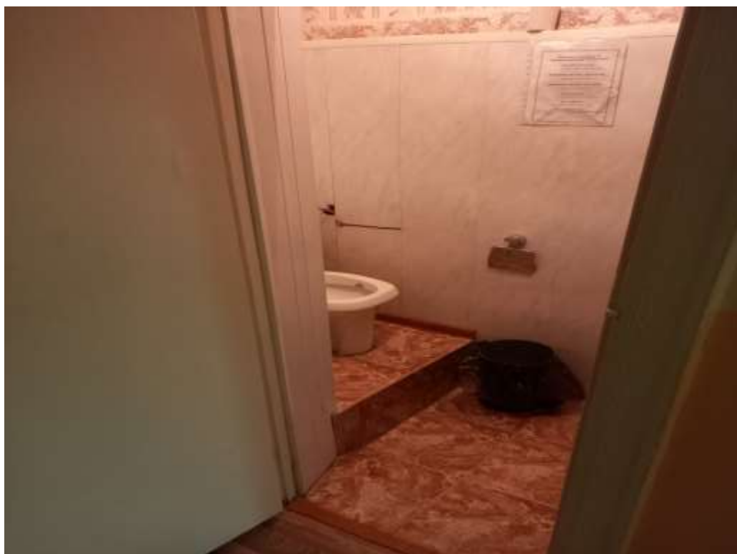
Фото № 5 туалетная комната для посетителей